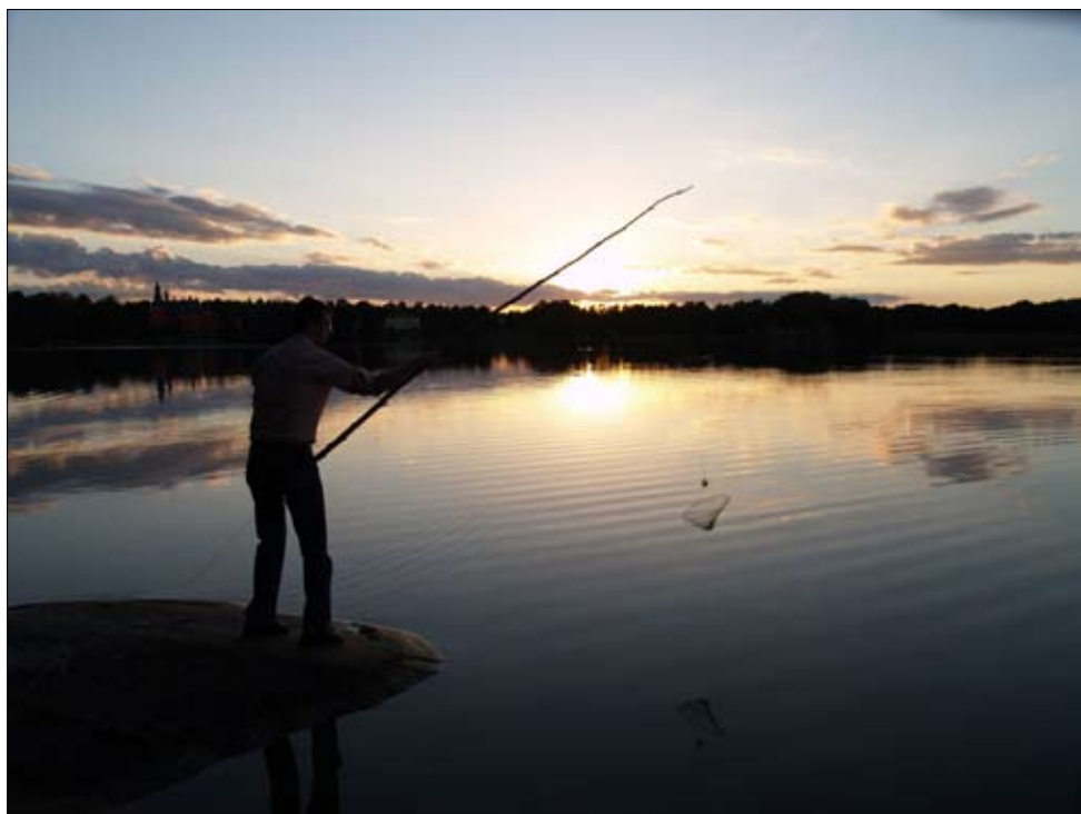
Kräfhåven gungas ut, kvällen kommer och med den kräftorna.

Börja kvällen med djupfiske. Använd en lång slana till att ”gunga” ut kräfhåvarna i vattnet. Välj ut de ställen där det ser ut