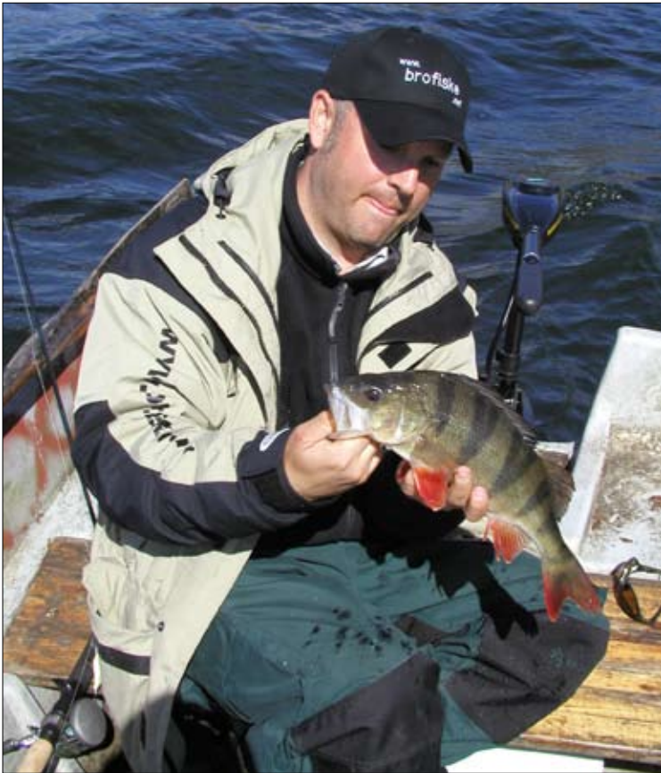
Vårabborren är ofta stor men kräver tid för att nappa.

här tidigt ge utdelning. Har du tillgång till båt så skall du absolut försöka på dina favoritställen på vintern och pimpla som vanligt. Detta kan vara mycket effektivt under den allra första isfria tiden. Trots detta är det kanske framför allt fisket med spö o rulle som nu tar sin början för säsongen. Den viktigaste regeln nu är att låta betet fiska så nära botten som möjligt. Abborren verkar nästan cementerad vid denna och kan vara helt omöjlig att lura till hugg någon annanstans. I fiskelitteraturen kan man läsa att abborrens