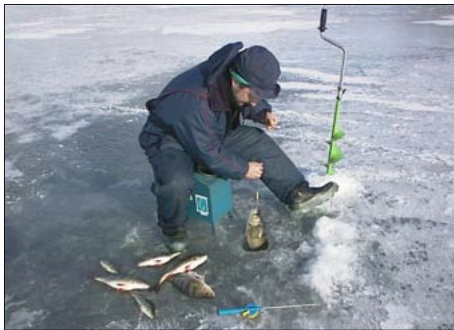
De första kontakterna med Storabborren var härliga.