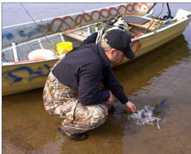
Stor fisk går alltid tillbaka med orden "Hämta Farfar".

Om du sitter i en båt så kan en liten wobbler med inte alltför kraftig och vibrerande gång också vara bra. I ärlighetens namn skall sägas att wobbler av andra än mig, hålls väldigt högt som höstbete för abborren. Är du mete intresserad gör du som tidigare presenterats dvs som Linus Johansson, fångar småmört och tacklar med en åttans trekrok under ett flöte och på detta metar du sedan den stora höstabborren.