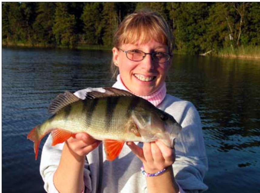
Höstabborre, åter fet och välmående efter vårens ansträngande lek.

Jag hade gått efter stranden och fiskat mig ända ut på djupudden. En härlig promenad som för det mesta brukar ge en o annan matabbore. Bergen mellan badet och djupudden är härliga fiskeplatser, steniga bottenar med kräftor som lockar storabborren, dock inte denna dag. Vi fiskare brukar ju säga "det gör inget, det var ju en härlig tur" men visst sjutton är det lite trist när inte fisken vill